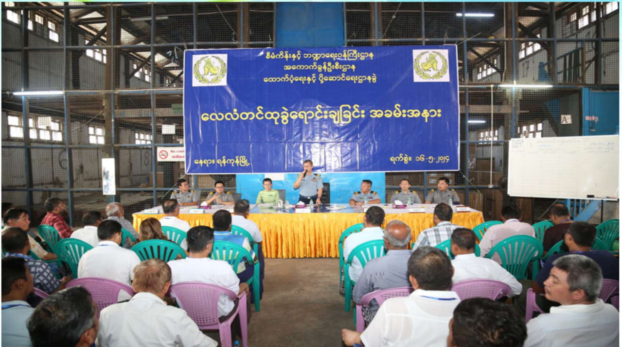
ပြည်သူ့ဘဏ္ဍာသိမ်းထုခွဲအဆင့်ရောက် B/N Excavator Spare parts ၊ အဝတ်ဖြတ်စများ ၊ Plastic Lunch Box ၊ ကားမှန်များနှင့် အထွေထွေကုန်ပစ္စည်းများအား ဈေးပြိုင်စနစ်ဖြင့် လေလံတင်ရောင်းချနေစဉ်။

အကောက်ခွန်ဦးစီးဌာနက ဖမ်းဆီးရမိပြီး ပြည်သူ့ဘဏ္ဍာသိမ်းထုခွဲအဆင့်ရောက် အမှုတွဲ (၃၆) မှုပါ ပစ္စည်းများဖြစ်ကြသည့် B/N Excavator Spare parts ၊ အဝတ်ဖြတ်စများ၊ Plastic Lunch Box ၊ ကားမှန်များနှင့် အထွေထွေကုန်ပစ္စည်းများအား ပစ္စည်းအတွဲ (၃) တွဲ ခွဲ၍ ဈေးပြိုင်စနစ်ဖြင့် လေလံတင်ထုခွဲရောင်းချခြင်းအခမ်းအနားကို ၂၀၂၄ ခုနှစ် မေလ ၁၆ ရက် နံနက် ၁၀ နာရီတွင် ရန်ကုန်မြို့ရှိ အကောက်ခွန်ဦးစီးဌာန ထောက်ပံ့ရေးနှင့်ပို့ဆောင်ရေးဌာနခွဲ၌ ကျင်းပသည်။