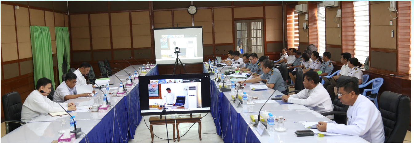
တရားမဝင်ကုန်သွယ်မှုတိုက်ဖျက်ရေးဦးဆောင်ကော်မတီလုပ်ငန်းညှိနှိုင်းအစည်းအဝေး(၂/၂၀၂၄) ဆုံးဖြတ်ချက်ပါ စံပြုလုပ်ငန်းစဉ်များနှင့်ပတ်သက်၍ လုပ်ငန်းညှိနှိုင်းအစည်းအဝေး ကျင်းပစဉ်။

တရားမဝင်ကုန်သွယ်မှုတိုက်ဖျက်ရေးဦးဆောင်ကော်မတီ လုပ်ငန်းညှိနှိုင်းအစည်းအဝေး(၂/၂၀၂၄) ဆုံးဖြတ်ချက်ပါ စံပြုလုပ်ငန်းစဉ်များ နှင့်ပတ်သက်၍ လုပ်ငန်းညှိနှိုင်းအစည်းအဝေး ကျင်းပ