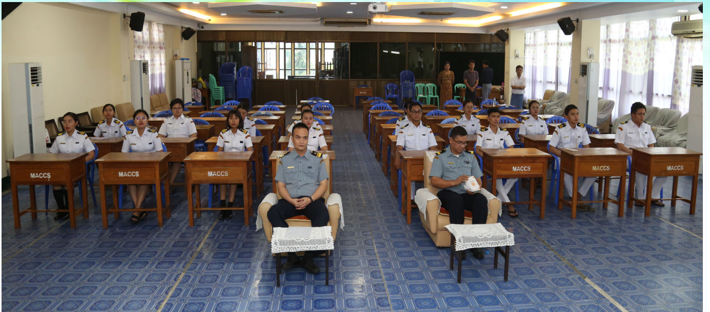
အကောက်ခွန်ဦးစီးဌာန အရာထမ်းအခြေခံသင်တန်း (၁/၂၀၂၄) သင်တန်းဆင်းအခမ်းအနား ကျင်းပစဉ်။