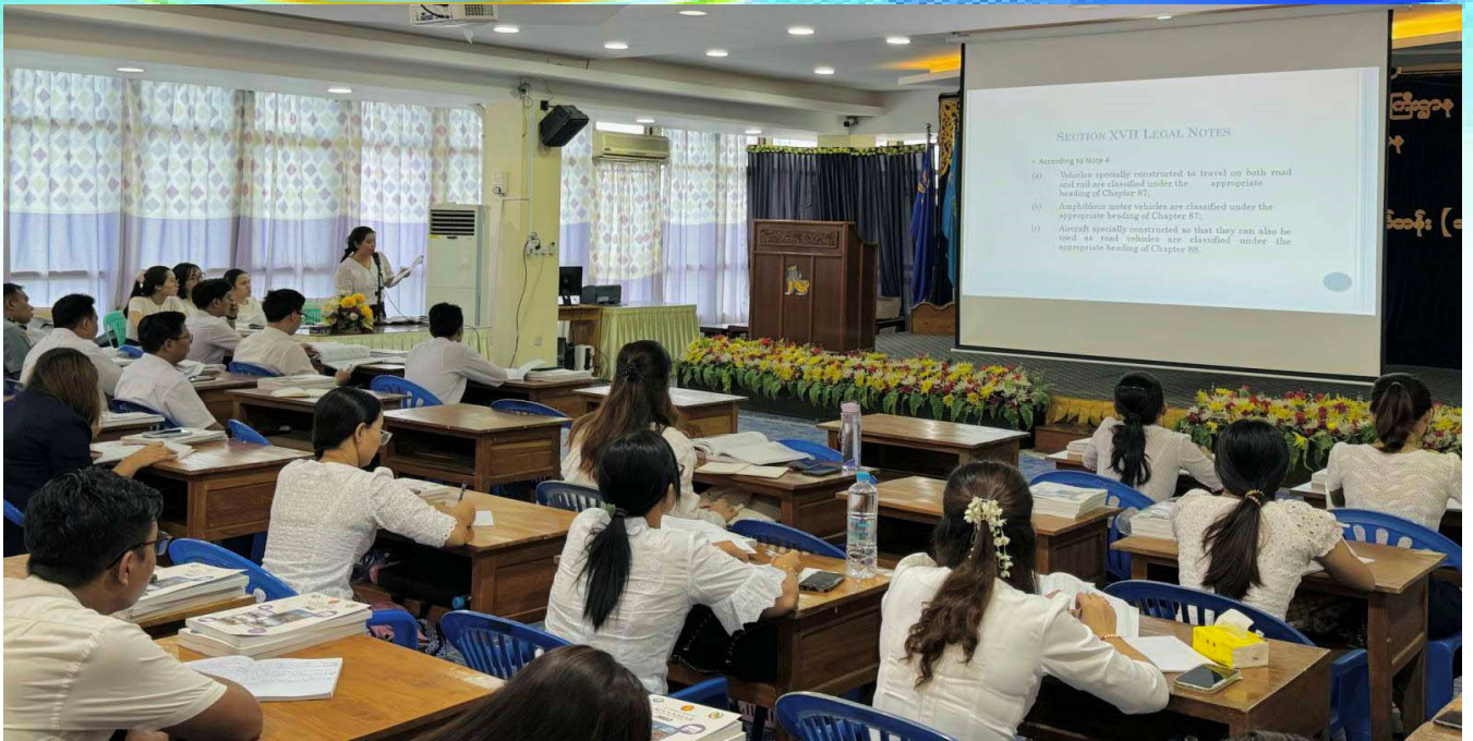
ကုန်ပစ္စည်းအမျိုးအစားခွဲခြားခြင်း (HS) သင်တန်းဖွင့်လှစ်သင်ကြားပို့ချနေစဉ်။

ကုန်ပစ္စည်းအမျိုးအစားခွဲခြားခြင်း (Harmonized System - HS) ဘာသာရပ်သင်တန်းကို ရန်ကုန်မြို့ရှိ အကောက်ခွန်ဦးစီးဌာန အကောက်ခွန်သင်တန်းကျောင်း ၌ ၂၀၂၄ ခုနှစ် မေလ ၂၈ ရက် မှ ၃၀ ရက်အထိ ဖွင့်လှစ်ခဲ့သည်။