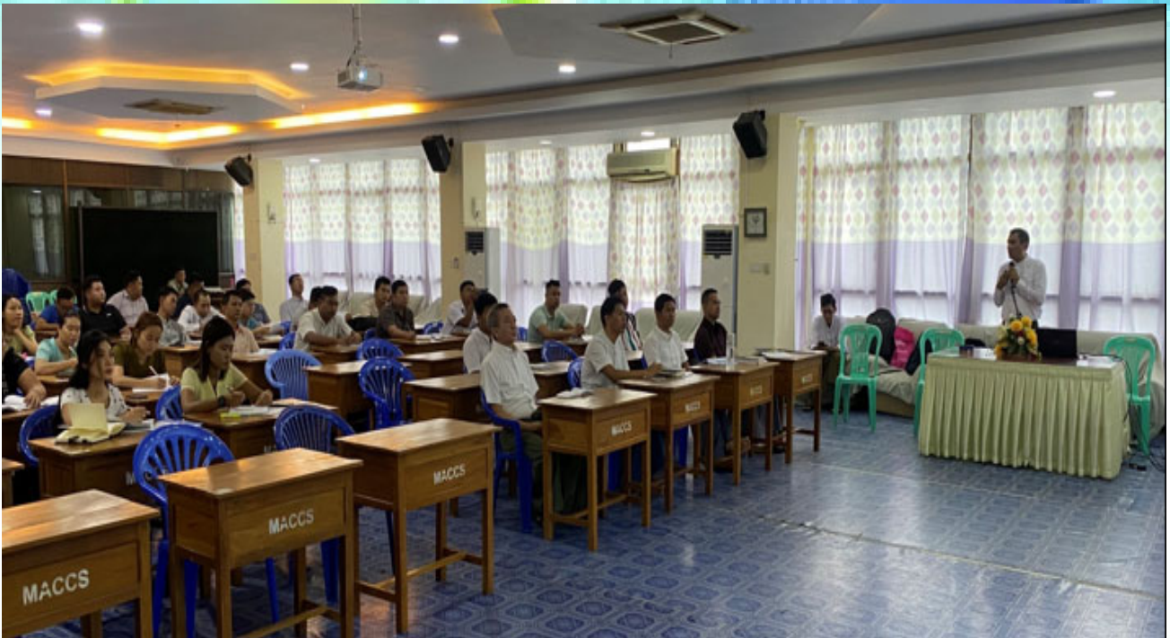
အကောက်ခွန်ဥပဒေဆိုင်ရာစွမ်းရည်မြှင့်တင်ရေးသင်တန်း ဖွင့်လှစ်သင်ကြားပို့ချနေစဉ်။

အကောက်ခွန်ဥပဒေဆိုင်ရာစွမ်းရည်မြှင့်တင်ရေးသင်တန်းကို ရန်ကုန်မြို့ရှိ အကောက်ခွန်ဦးစီးဌာန အကောက်ခွန်သင်တန်းကျောင်း ၌ ၂၀၂၄ ခုနှစ် မေလ ၂၀ ရက် မှ ၂၄ ရက် အထိ ဖွင့်လှစ်ခဲ့သည်။