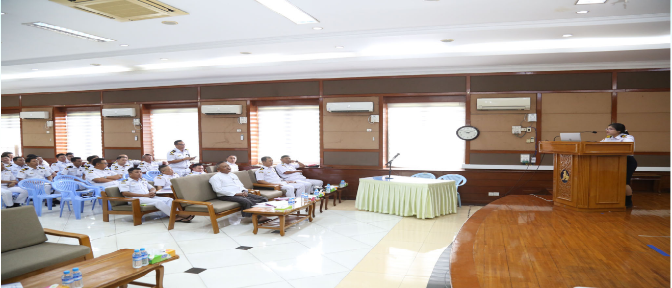
ကမ္ဘာ့အကောက်ခွန်အဖွဲ့၏ အခွင့်ရစီးပွားရေးလုပ်ငန်းဆောင်ရွက်သူအစီအစဉ်ဆိုင်ရာ ဒေသခွဲအလုပ်ရုံဆွေးနွေးပွဲနှင့်စပ်လျဉ်းသည့် အတွေ့အကြုံရှင်းလင်းပွဲ ကျင်းပစဉ်။

ကမ္ဘာ့အကောက်ခွန်အဖွဲ့၏ အခွင့်ရစီးပွားရေးလုပ်ငန်းဆောင်ရွက်သူအစီအစဉ်ဆိုင်ရာ ဒေသခွဲ အလုပ်ရုံဆွေးနွေးပွဲ (WCO Sub-Regional Workshop on Authorized Economic Operator (AEO) Programme for the WCO Members region) နှင့်စပ်လျဉ်းသည့် အတွေ့အကြုံရှင်းလင်းပွဲကို ၂၀၂၄ ခုနှစ် မေလ ၃ ရက် နံနက် ၉ နာရီက ရန်ကုန်မြို့ရှိ အကောက်ခွန်ဦးစီးဌာန ဇေယျာသီဟခန်းမ၌ ကျင်းပခဲ့သည်။