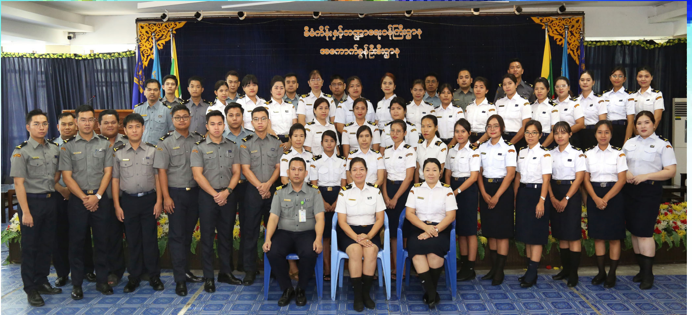
ကောင်းမွန်သောစီမံမှုလုပ်ထုံးလုပ်နည်းကျင့်သုံးရေးနှင့်စပ်လျဉ်းသည့် သိကောင်းစရာများဆိုင်ရာသင်တန်း အမှတ်တရဓာတ်ပုံရိုက်ကူးစဉ်။

ရွက်မှုအား မြှင့်တင်သွားရန် ၊ လက်ရှိဆောင်ရွက်နေသည့် လုပ်ငန်းစဉ်များနှင့်စပ်လျဉ်း၍ အကျိုးသက်ရောက်မှုများကို စိစစ်ပြီး လုပ်ငန်းစဉ်များအားလုံးတွင်ပါဝင်သည့် ပြုပြင်ရမည့်အချက်များမှ အဟန့်အတားများကို ဦးစားပေးဖော်ထုတ်ကာ အစီအစဉ်ချမှတ်၍ စနစ်တကျဆောင်ရွက်သွားရန် ရည်ရွယ်ဖွင့်လှစ်ခြင်း ဖြစ်သည်။