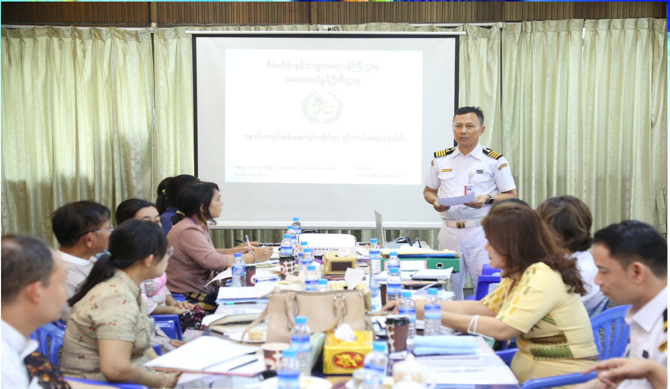
နှောင်းစာရင်းစစ်ဆေးခြင်းနှင့် အခွန်စာရင်းစစ်ဆေးခြင်းဆိုင်ရာကိစ္စရပ်များနှင့် စပ်လျဉ်း၍ တွေ့ဆုံဆွေးနွေးပွဲကျင်းပနေစဉ်။

ထို့နောက် PCA မှ သတင်းစာရင်းပေးပို့ထားသော လျော့နည်းခွန်များအပေါ် ပြည်တွင်းအခွန်များဦးစီးဌာန မှ ဆောင်ရွက်ပြီးစီးမှုကို အကြောင်းပြန်ကြားရန်နှင့် နောင်ကျင်းပမည့် (၃) လ တစ်ကြိမ် အစည်းအဝေးတွင် အကောက်ခွန်ဦးစီးဌာန မှ အကောက်ခွန်တန်ဖိုး သတ်မှတ်ခြင်းဆိုင်ရာကိစ္စရပ်များနှင့် ပြည်တွင်းအခွန်များဦးစီးဌာန မှ အခွန်စည်းကြပ်ခြင်းဆိုင်ရာကိစ္စရပ်များကို ဆွေးနွေးသွားရန် ဆုံးဖြတ်ကြသည်။