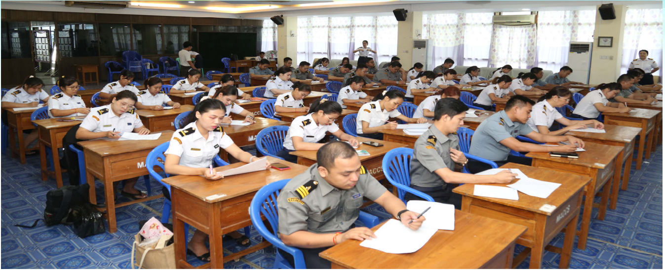
ကောင်းမွန်သောစီမံမှုလုပ်ထုံးလုပ်နည်းကျင့်သုံးရေးနှင့်စပ်လျဉ်းသည့် သိကောင်းစရာများဆိုင်ရာသင်တန်း ဖွင့်လှစ်နေစဉ်။