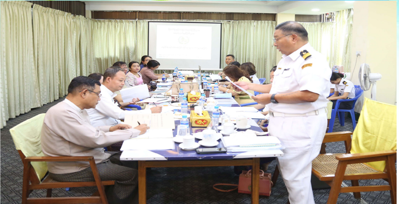
နှောင်းစာရင်းစစ်ဆေးခြင်းနှင့် အခွန်စာရင်းစစ်ဆေးခြင်းဆိုင်ရာကိစ္စရပ်များနှင့် စပ်လျဉ်း၍ တွေ့ဆုံဆွေးနွေးပွဲကျင်းပနေစဉ်။

အာဆီယံလမ်းညွှန်ချက်အရ အကောက်ခွန်ဦးစီးဌာန နှင့် ပြည်တွင်းအခွန်များဦးစီးဌာန အာဏာပိုင်များအကြား ပူးပေါင်းဆောင်ရွက်မှုလုပ်ဆောင်နိုင်မည့်နယ်ပယ်များအနက် နှောင်းစာရင်းစစ်ဆေးခြင်းနှင့် အခွန်စာရင်းစစ်ဆေးခြင်းဆိုင်ရာကိစ္စရပ်များနှင့် စပ်လျဉ်းသည့် တွေ့ဆုံဆွေးနွေးပွဲ အခမ်းအနားကို ၂၀၂၄ ခုနှစ် မေလ ၆ ရက် မွန်းလွဲ ၁ နာရီက ရန်ကုန်မြို့ရှိ အကောက်ခွန်ဦးစီးဌာန အကောက်ခွန်သင်တန်းကျောင်း အစည်းအဝေးခန်းမ၌ ကျင်းပသည်။