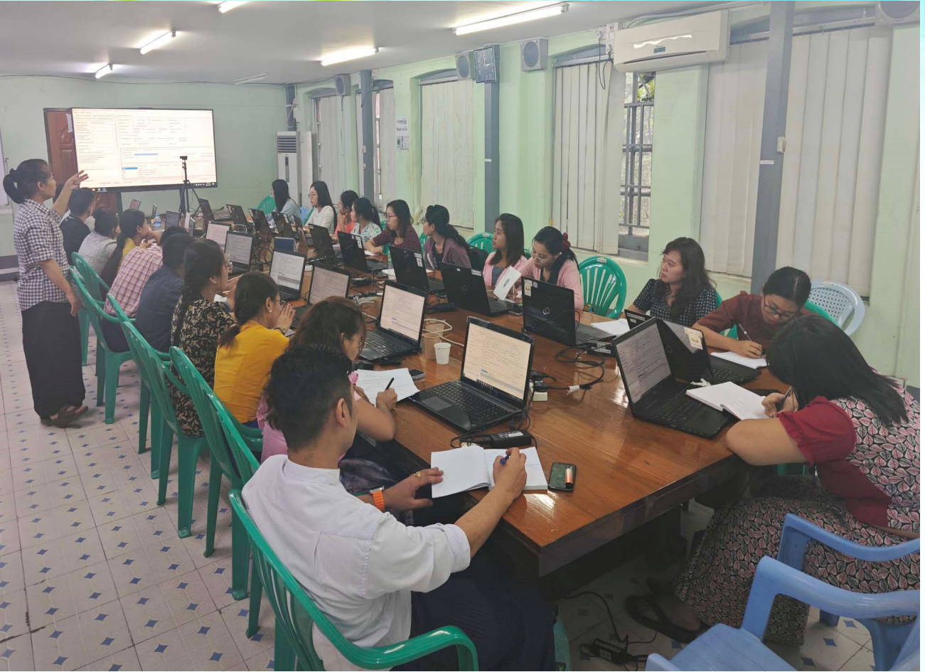
MACCS System ဖြင့် စစ်ဆေးဆောင်ရွက်ရမည့် နည်းလမ်းများ သင်ကြားပို့ချနေစဉ်။

MACCS System ဖြင့် စစ်ဆေးဆောင်ရွက်ရမည့်နည်းလမ်းများ သင်ကြားပို့ချခြင်းသင်တန်း အမှတ်စဉ် (၃) ကို MACCS ဌာနခွဲ အစည်းအဝေးခန်းမ၌ ၂၀၂၄ ခုနှစ် မေလ ၂ ရက် မှ ၁၃ ရက် နေ့ အထိ လည်းကောင်း၊ အမှတ်စဉ် (၄) ကို MACCS ဌာနခွဲ အစည်းအဝေးခန်းမ၌ ၂၀၂၄ ခုနှစ် မေလ ၂၇ ရက် မှ ဇွန်လ ၅ ရက် နေ့ အထိ လည်းကောင်း စာတွေ့လက်တွေ့ ဖွင့်လှစ်သင်ကြားခဲ့သည်။